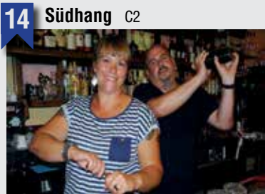
14 Südhang C2

Max-Brauer-Allee 251, 22769 HH, T: 040 41494529