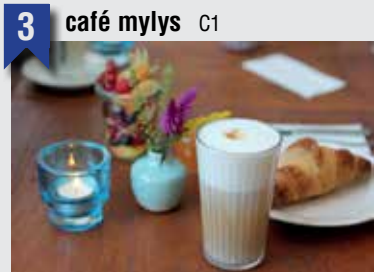
3 café mylys C1

Weidenallee 23, 20357 HH, T: 040 43274343