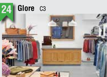
24 Glore C3

Marktstraße 117, 20357 HH, T: 040 43190904