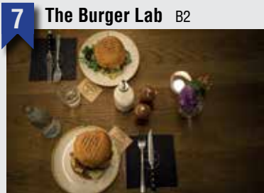
7 The Burger Lab B2

Weidenallee 12, 20357 HH, T: 040 41498865