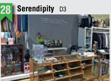
28 Serendipity D3

Marktstraße 15, 20357 HH, T: 040 43190787