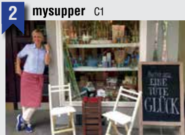
2 mysupper C1

Ein Mekka für Foodlovers: Leckerer und kulinarisch Besonderer, mit Leidenschaft zusammengestellt und in Genuss-Tüten verpackt für Leute mit Geschmack. Ganz Hamburg immer Tüte? Das passt: Der Elbgold-Kaffee steht für die Speicherstadt, der Naschbüdel für schanzranische Offenheit. Der Sommerhonig betont das Grün der Stadt und die Elstrand-Schokolade das Wasser, während Schokolade-Fleite an die große Zeit des Hafens erinnert. Der Schietwettertee symbolisiert Optimismus, und die Bio-Marmelade ist eine Reminiszenz an die Große Freiheit. Ein Besteller, den sich auch Hamburger gönnen.