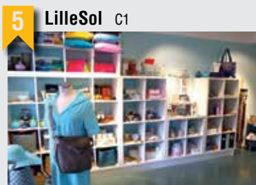
5 LilleSol C1

Ob kleines Mitbringsel oder hochwertiges Geschenk, hier findet man bezaubernde Dinge, mit denen man andere beschenken oder sich selbst eine Freude machen kann.