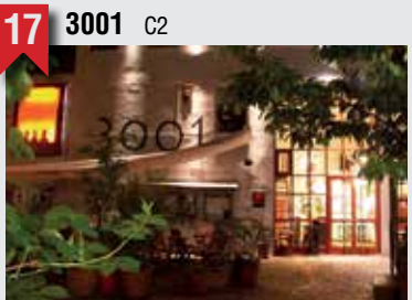
19 Flohschanze C3

Schanzenstraße 75, 20357 HH, T: 040 437679