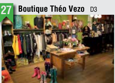
27 Boutique Théo Vezo D3

Marktstraße 15, 20357 HH, T: 040 28004952