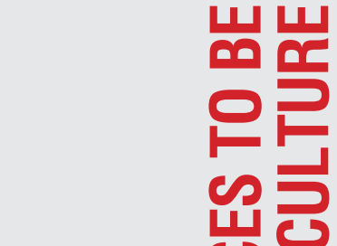
9 Kiilimanschanzo B2

Susannenstraße 29, 20357 HH, T: 040 43099099