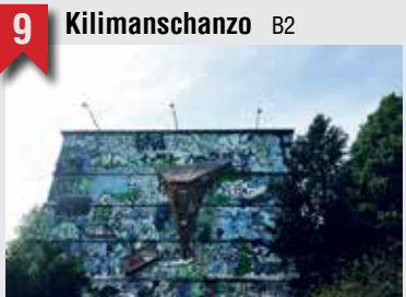
17 3001 C2

Die besten Geschichten schreibt nicht das Leben, sondern das Drehbuch. Und die allerbesten gibt's in einem versteckten Schanzenhinterhof, im 3001.