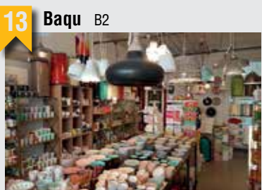
13 Baqu B2

Die riesige Auswahl an Trendprodukten für Küche und Wohnung, ergänzt um originelle Geschenkartikel, erstreckt sich auf 400 m 2 in 15 Räumen.