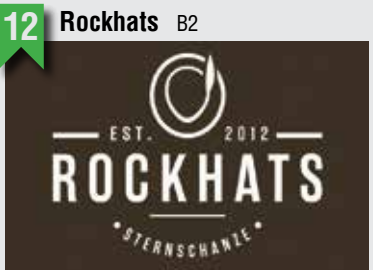
12 Rockhats B2

Juliussstraße 33, 22769 HH, T: 040 40186386