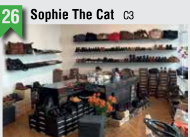
26 Sophie The Cat C3

Marktstraße 137, 20357 HH, T: 040 36916422