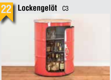
22 Lockengelöt C3

Schlüsselbretter aus Büchern, Wandleuchten aus LPs, Flaschenöffner aus Kickerfiguren. In Handarbeit werden Alltagsgegenstände in Wohnobjekte umgewandelt.