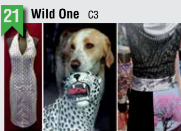
21 Wild One C3

Susannenstraße 29, 20357 HH, T: 040 4390043