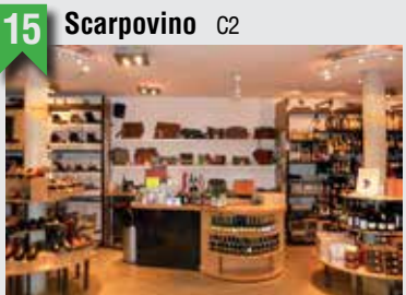
15 Scarpovino C2

Schullerblatt 92, 20357 HH, T: 040 60098768