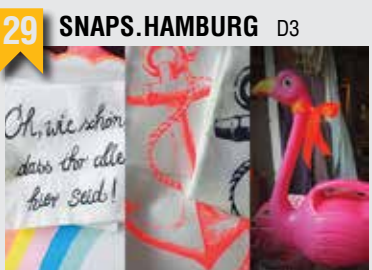
29 SNAPS.HAMBURG D3

Marktstraße 114, 20357 HH, T: 040 89001326