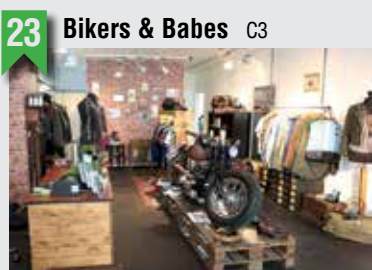
23 Bikers & Babes C3

Marktstraße 100, 20357 HH, T: 040 87600555