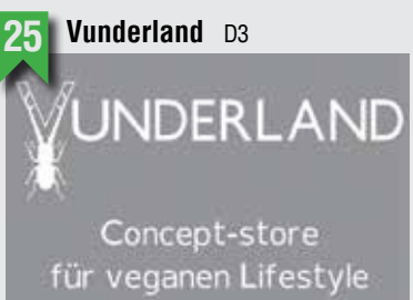
25 Vunderland D3

Marktstraße 31, 20357 HH, T: 040 35777650