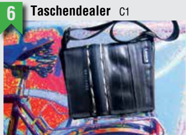
6 Taschendealer C1

Weidenallee 17, 20357 HH, T: 040 44465983