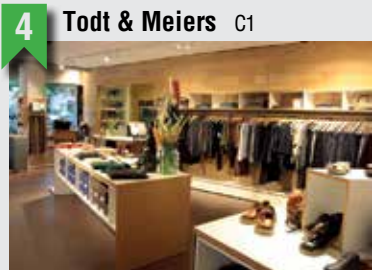
4 Todt & Meiers C1

Weidenallee 61, 20357 HH, T: 040 43096634