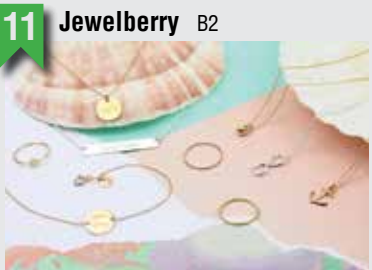
11 Jewelberry B2

Kleiner Schäferkamp 44, 20357 HH, T: 040 59466970