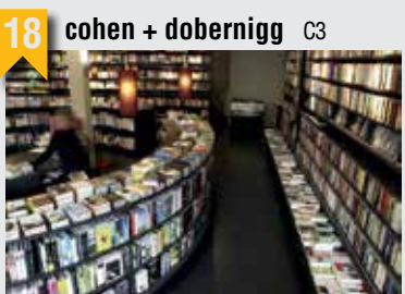
18 cohen + dobernigg C3

Susannenstraße 39-41, 20357 HH, T: 040 433814