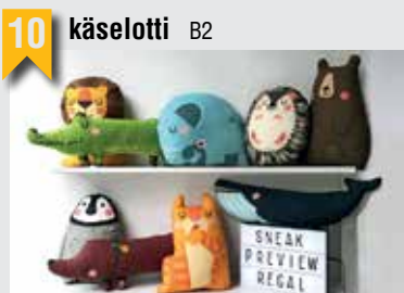
10 käselotti B2

Schullerblatt 85, 20357 HH, T: 040 65916483