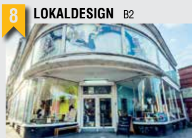
8 LOKALDESIGN B2

Weidenallee 4, 20357 HH, T: 0173 2433813